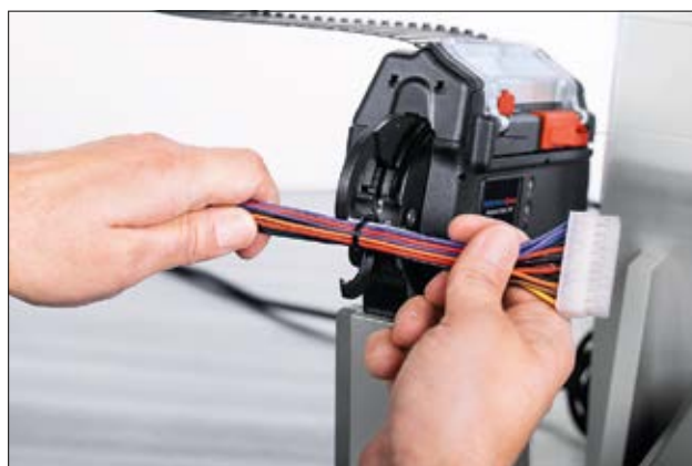
Application de frettage avec l'AT2000CPK installé sur le banc fixe.