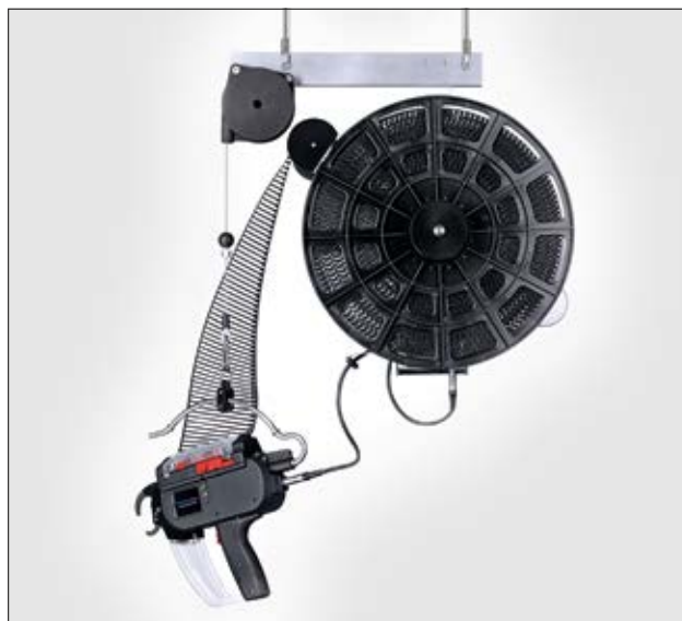
Ensemble comprenant la suspension haute, l'outil AT2000CPK, l'alimentation secteur et le consommable en rouleau (T18RA3500).