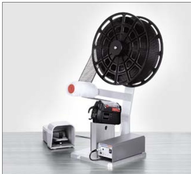
Ensemble comprenant le banc fixe avec la pédale, l'outil AT2000CPK, l'alimentation secteur et le consommable en rouleau (T18RA3500).