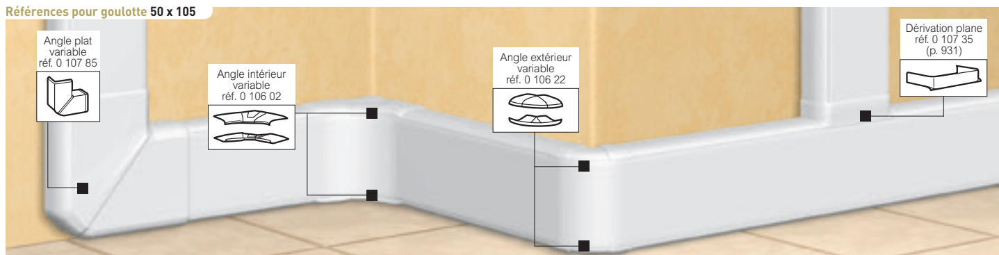
Tableau de choix profilés, accessoires de cheminements et dérivations p. 930 Tableau de capacité p. 940

IP 40 - IK 07 Conforme à la norme NF EN 50085-2-1 (voir catalogue en ligne)