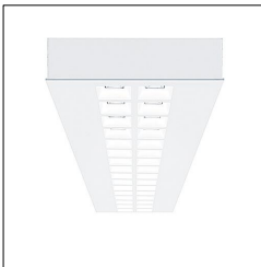
Plafonnier encastré à LED MIRL NIV LED3800-840 M600L LDO 42925983

La présente déclaration de produit environnemental (EPD) est basée selon les normes EN ISO 14025 et EN 15804 et décrit les impacts spécifiques environnementaux du produit mentionné. Cette déclaration fait suite également aux exigences spécifiques et concrètes du programme Institut Bauen und Umwelt e.V. (IBU) selon les règles de calcul des LCA et le contenu de l'EPD (de base) selon les instructions de PCR sous-jacentes (PCR: Règles de catégorie de produit) pour «Luminaires, lampes et composants pour luminaires» (Ref: IBU PCR Teil A et B). Le produit décrit sert d'unité déclarée. La déclaration inclut une description du produit, des informations sur la composition des matériaux, la production, le transport, la phase d'utilisation, l'élimination et le recyclage, ainsi que les résultats de l'évaluation du cycle de vie. Les EPD des produits de construction sont comparables uniquement si les valeurs sont calculées conformément au même PCR et des scénarios d'utilisation appropriés et obligatoires.