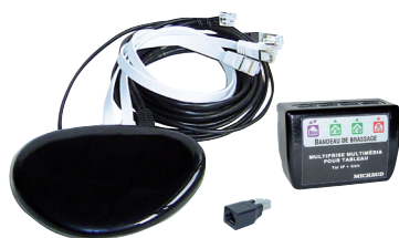
Kit box en ambiance Gbit FTTH (Q183)