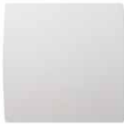
GRAPHIC vue de face