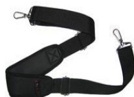
SANGLE À ÉPAULE 2 POINTS