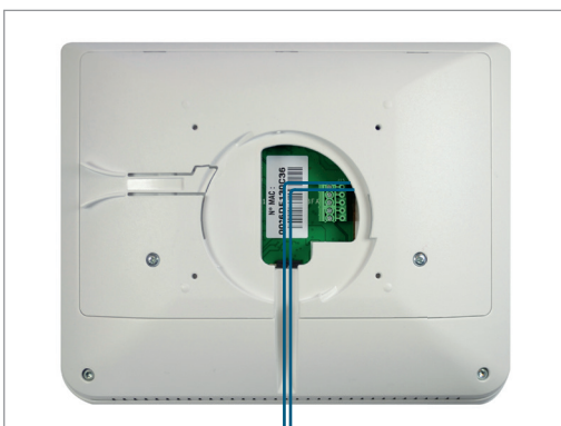
4 Remontez le capot arrière (2 vis).