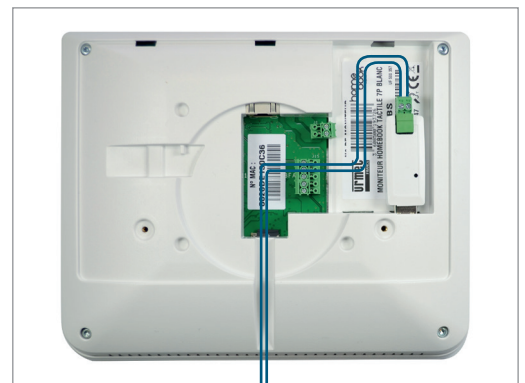
3 Insérez la clé USB.