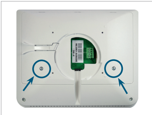
1 Démontez le capot arrière du moniteur HBS (2 vis).