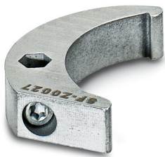
Clé à ergot, série: RC

https://www.phoenixcontact.com/fr/produits/1607455