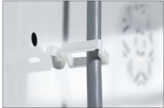
Clip de la série WPC, en application.