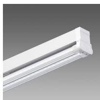
6502 Rapid system - bi-émission LED