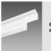
6616 Techno System HE - diffuseur hémisphérique extensif - CRI 80