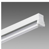
6402 Rapid system - mono-émission LED