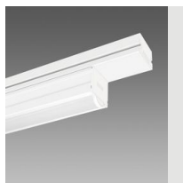
6605 Techno System - diffuseur hémisphérique extensif - CRI 90