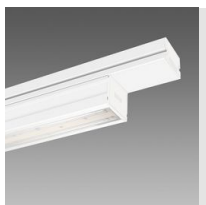
6602 Techno System - asymétrique double 25° - CRI 90