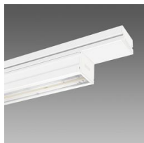
6601 Techno System - asymétrique 25° - CRI 90