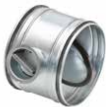
RGE à joint manuel

Le registre RGE permet d'équilibrer et isoler manuellement un réseau circulaire tout en garantissant un très faible taux de fuite.