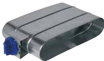
Registre d'Equilibrage Oblong

Le registre d'équilibrage oblong permet de régler la pression dans des branches de réseaux aérauliques en oblong en bâtiment tertiaire ou collectif.