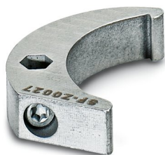
Clé à ergot, série: RC

https://www.phoenixcontact.com/fr/produits/1607455