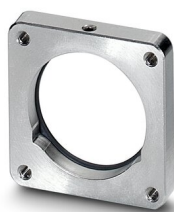
Bride de montage à quatre pans, Joint axial, 4xM3, cote de bride: 35 mm x 35 mm, série: RF, Produit de remplacement selon RoHS II sans exception 6c (Pb < 0,1 %) référence : 1242369

https://www.phoenixcontact.com/fr/produits/1607905