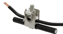
CM 60 S