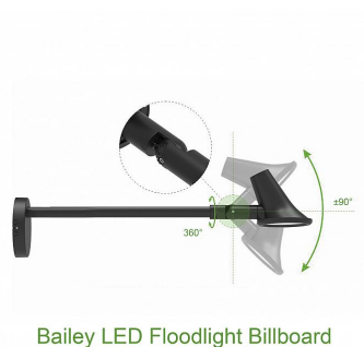
Bailey LED Floodlight Billboard