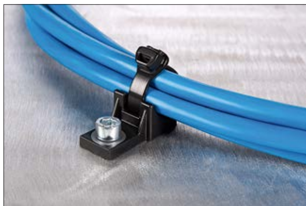
Collier de la série X combiné à une embase à visser, en application.