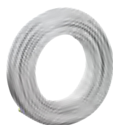
Tube Multicouche Uni Pipe PLUS en couronne