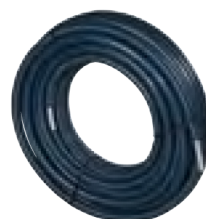
Tube Multicouche Uni Pipe pré-isolé en couronne*

+ Le tube Multicouche pré-isolé est recouvert d'un isolant en mousse de polyéthylène de 6 à 26 mm d'épaisseur. Isolant carré pour le diamètre 26 mm afin de faciliter le passage en gaine. Lambda : 0,04W/m.°C.