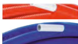
Tube Multicouche Uni Pipe PLUS pré-gainé