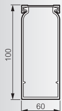
Segma réf. 21172