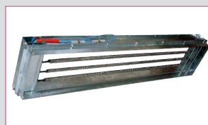
Kit électrique RBUM