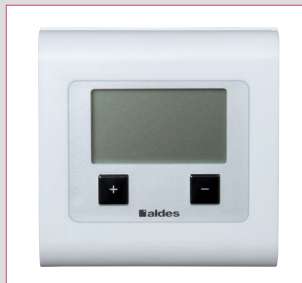
Thermostat sans fil