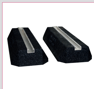
Kit support sol