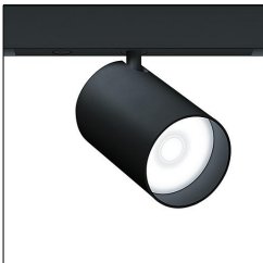
Projecteur d'accentuation à LED SUP2 L LED1250-930 FL LDO BK 42927706