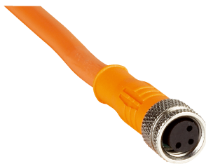
illustration non contractuelle