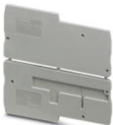
Flasque d'extrémité, Longueur: 74,4 mm, Largeur: 2,2 mm, Hauteur: 33,8 mm, Coloris: gris

Remarque : les données indiquées ici sont tirées du catalogue en ligne. Vous trouverez toutes les informations et données dans la documentation utilisateur. Les conditions générales d'utilisation pour les téléchargements sur Internet sont applicables. ( http://phoenixcontact.fr/download )