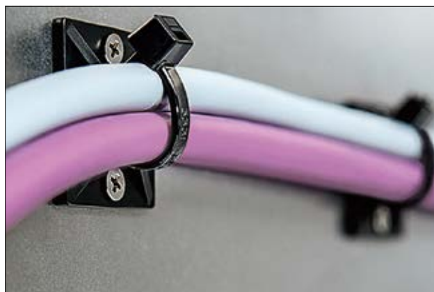
Embases carrées, adhésives ou à visser, de la série MB, en application.