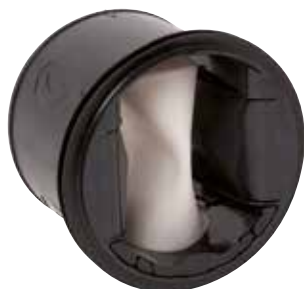
MR Mono HP

Le MR Mono est un régulateur de débit garantissant un débit stable à haute pression pour maîtriser QAI, confort et économie d'énergie du local.