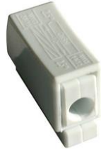
Bornes de connexion: Connecteur convecteur