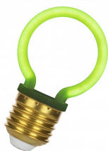
144344 LED Neon G45 E27 2W Vert