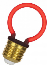
144343 LED Neon G45 E27 2W Rouge