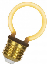
144342 LED Neon G45 E27 2W Blanc