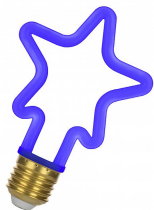
143068 LED Neon Star E27 4W Bleu