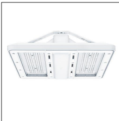
Luminaire industriel à LED CR2PL M25k-840 PC WB LDO WH 42187559

La présente déclaration de produit environnemental (EPD) est basée selon les normes EN ISO 14025 et EN 15804 et décrit les impacts spécifiques environnementaux du produit mentionné. Cette déclaration fait suite également aux exigences spécifiques et concrètes du programme Institut Bauen und Umwelt e.V. (IBU) selon les règles de calcul des LCA et le contenu de l'EPD (de base) selon les instructions de PCR sous-jacentes (PCR: Règles de catégorie de produit) pour «Luminaires, lampes et composants pour luminaires» (Ref: IBU PCR Teil A et B). Le produit décrit sert d'unité déclarée. La déclaration inclut une description du produit, des informations sur la composition des matériaux, la production, le transport, la phase d'utilisation, l'élimination et le recyclage, ainsi que les résultats de l'évaluation du cycle de vie. Les EPD des produits de construction sont comparables uniquement si les valeurs sont calculées conformément au même PCR et des scénarios d'utilisation appropriés et obligatoires.