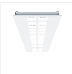
Plafonnier encastré à LED MIRL LAY LED2800-840 M600L LDO KA 42925923

La présente déclaration de produit environnemental (EPD) est basée selon les normes EN ISO 14025 et EN 15804 et décrit les impacts spécifiques environnementaux du produit mentionné. Cette déclaration fait suite également aux exigences spécifiques et concrètes du programme Institut Bauen und Umwelt e.V. (IBU) selon les règles de calcul des LCA et le contenu de l'EPD (de base) selon les instructions de PCR sous-jacentes (PCR: Règles de catégorie de produit) pour «Luminaires, lampes et composants pour luminaires» (Ref: IBU PCR Teil A et B). Le produit décrit sert d'unité déclarée. La déclaration inclut une description du produit, des informations sur la composition des matériaux, la production, le transport, la phase d'utilisation, l'élimination et le recyclage, ainsi que les résultats de l'évaluation du cycle de vie. Les EPD des produits de construction sont comparables uniquement si les valeurs sont calculées conformément au même PCR et des scénarios d'utilisation appropriés et obligatoires.