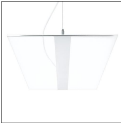
Luminaire suspendu à LED VAERO 5000-840 LDE WH 42184828