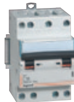
4 079 07