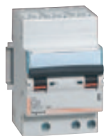
4 078 46