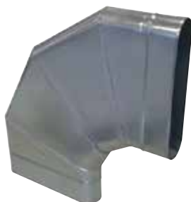
Coude Horizontal Oblong 90°

Le coude horizontal oblong 90° permet de changer la direction d'un réseau oblong de 90° dans le plan du réseau.