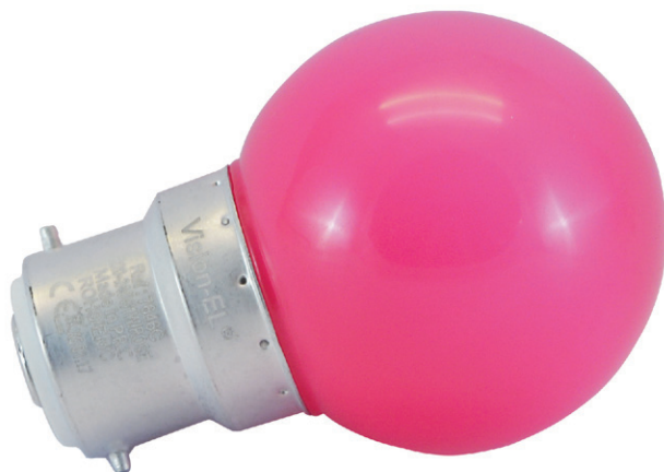
Ampoules incassables (globe en polycarbonate)