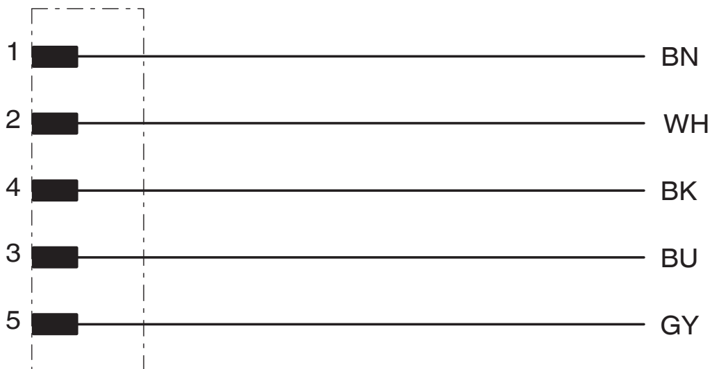
Schéma de connexion

https://www.phoenixcontact.com/fr/produits/1436411