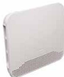
Vue de côté entrée d'air hygroréglable EFT 2