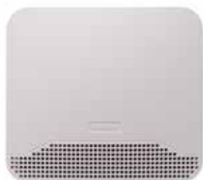
Vue de face entrée d'air hygroréglable EFT 2

EHT 2 la solution haute performance acoustique en traversée de mur.