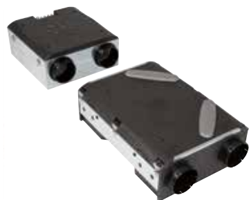
Moto ventilateur HY

Solution de ventilation double flux modulaire pour s'adapter à toutes les configurations d'installation possibles.