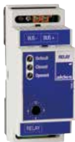
Module Relay Mod

Le Module Relay Mod permet au système VMT d'envoyer des informations vers d'autres éléments pour optimiser le fonctionnement de tous les systèmes.