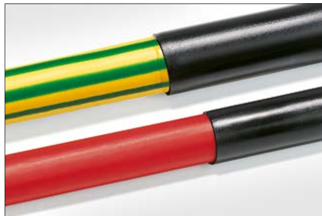
Les gaines à paroi adhésive TA32 et TA42 sont homologuées UL224.