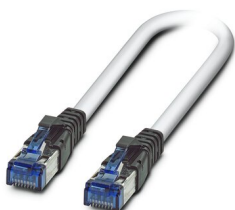
Câble de jonction, CAT6, préconfectionné, 1,0 m

https://www.phoenixcontact.com/fr/produits/2891385