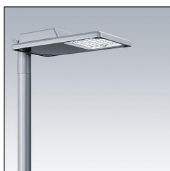
Luminaire d'éclairage routier à LED IS S 36L70-730 NR CL2 WS0.3 M60 GY-S 96636162