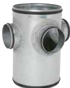
Collecteur Raccord d'Étage à joints

Le CRE à joints permet de raccorder 1 à 3 piquages en diamètre 125 sur la colonne verticale tout en assurant une étanchéité classe C.