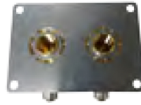
Kit Robifix* double 60 mm à sertir

* Robifix est une marque déposée de GRIPP