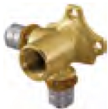
Raccord mural double 90°