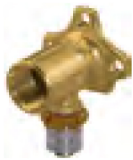
Raccord mural simple allongé