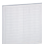
0 387 27

Impression et tenue garanties uniquement avec l'imprimante réf. 0 387 00 Utilisation intérieure