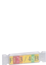
0 387 14 avec porte-repère 0 387 16