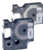
0 385 82/87