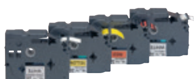
0 389 03/05/06/09