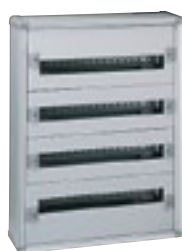
0 200 04

Tenue au feu selon CEI 60695-2-11 : 750 °C pour installation dans les ERP Châssis extractible avec rails montés. Barreau laiton pour conducteurs de protection monté : 36 trous 1,5 à 10 mm 2 et 2 trous 35 mm 2 Capacité 24 modules par rangée. RAL 7035 Livrés complets avec rails et plastrons. Portes à commander séparément Permettent la réalisation d'ensembles certifiés selon NF EN 61439-2 et -3 IP 43 - IK 08 avec joint et porte IP 40 - IK 08 avec porte IP 30 - IK 07 sans porte Flancs latéraux amovibles. Haut et bas amovibles et sécables pour insérer la plaque passe-câbles découpable (à commander séparément)