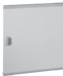
0 202 73