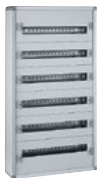
0 200 06

coffrets de distribution métal "prêts à l'emploi"