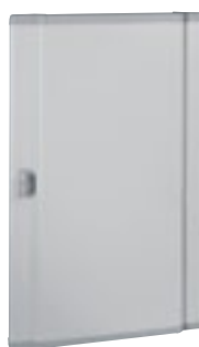
0 202 55