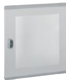
0 202 83