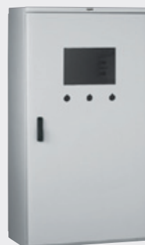
Armoire Marina percée et équipée en usine

Réalisation de perçages sur toutes les parties de l'armoire, porte interne, plaque pleine... Plans de perçage à fournir (format pdf, dxf, ...)