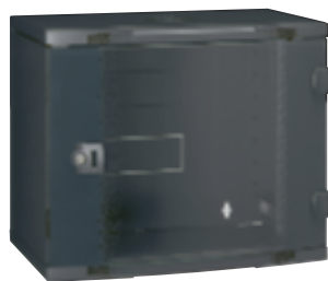
0 462 01