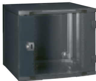
0 462 11