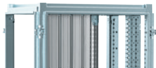
4 046 00