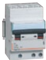
4 078 46