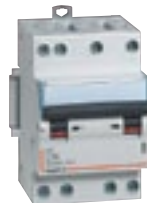
4 079 07