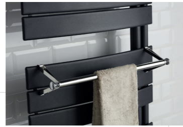
BARRE SUPPORT À EMBOUT