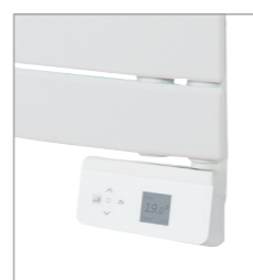
Modèle Digital sans soufflerie