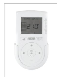
Modèle Intégral avec soufflerie