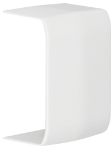
Joint de fond et couvercle BP