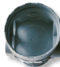
Opercule défonçable pour noyer la boîte

Maxibanque est agréée par le laboratoire d'essais acoustiques CSTB.